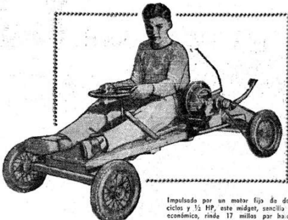
Impulsado por un motor fijo de dos ciclos y 1/2 HP, este midget, sencillo y económico, rinde 17 millas por hora.

El motor de medio H.P. utilizado en el proyecto Original puede ser substituido por un motorcito para bicicleta, al que se proveerá de una polea adecuada.